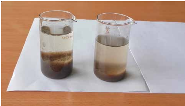
3 pav. Nusistovėjęs dumblas: kairėje – Vilniaus nuotekų valyklos; dešinėje – tiriamo įrenginio AT-6

Palyginus veiklųjį dumblą iš tiriamojo įrenginio AT-6 (3 pav., dešinėje) su dumblu iš Vilniaus nuotekų valyklos aerotanko (3 pav., kairėje), matyti nusistovėjusio skysčio skaidrumo skirtumas. Didelės Vilniaus nuotekų valyklos dumblo skystis skaidresnis, nusėdęs dumblas geriau atsiskyręs (nors jo yra daugiau). Atlikus veikliojo dumblo mikroskopavimo tyrimus pastebėta, kad veikliajame dumble iš Vilniaus nuotekų valyklos yra daug skaidriųjų: infuzorijų, verpečių, kirmėlių, kiautinių amebų. Tiriamajame veikliajame dumble (iš AT-6) šių biologinių indikatorių nepastebėta (5 pav., 1 nuotr.).