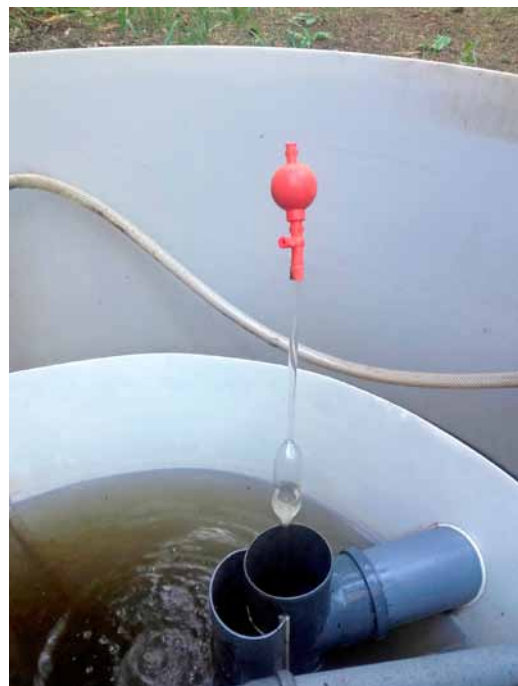
2 pav. Mėginio paėmimas Fig. 2. Sample collection

čia V_1 ir V_2 – 20 mM KMnO 4 tirpalo tūriai sunaudoti kontroliniam ir bandomajam mėginiui nutitruoti (ml); 50 – koeficientas, rodantis H 2 O 2 kiekį (μmol), atitinkantį 20 mM KMnO 4 tirpalo 1 ml; C – dumblo mėginio tūris (ml) arba baltymo kiekis mėginyje (mg); t – inkubacijos laikas (min).