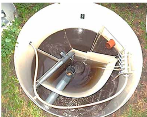
1 pav. AT-6 buitinių nuotekų valymo įrenginis Fig. 1. Household wastewater treatment plant AT-6

Skendinčiųjų medžiagų koncentracija įvertinta gravimetriniu metodu, nuotekas košiant per stiklo pluošto koštuvą (LAND 46–2007), sverta KERN (Vokietija) ABJ 220–4M tipo elektroninėmis laboratorinėmis svarstyklėmis.